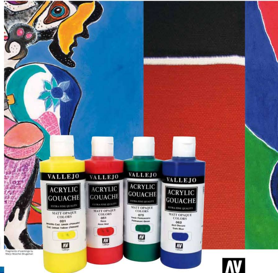
Fragments of paintings by Marjo Wüschler-Brugaman