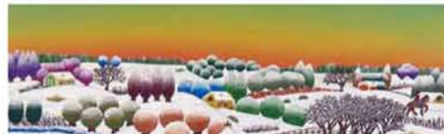
Fragments of paintings and stone by Yiyo Moro

Eine weitere Beschreibung der Pigmente in diesem Produkt finden Sie in dem internationalen Color Index in unsere webseite. VERPACKUNG: 35ml und 200ml.