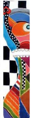
Fragments of paintings by Marjo Wüschler-Brugaman www.atelier-marjo.ch

Voor verdere toelichting over de pigmenten in dit product verwijzen wij U naar de internationale Color Index in onze web. ASSORTIMENT: 35ml en 200ml.